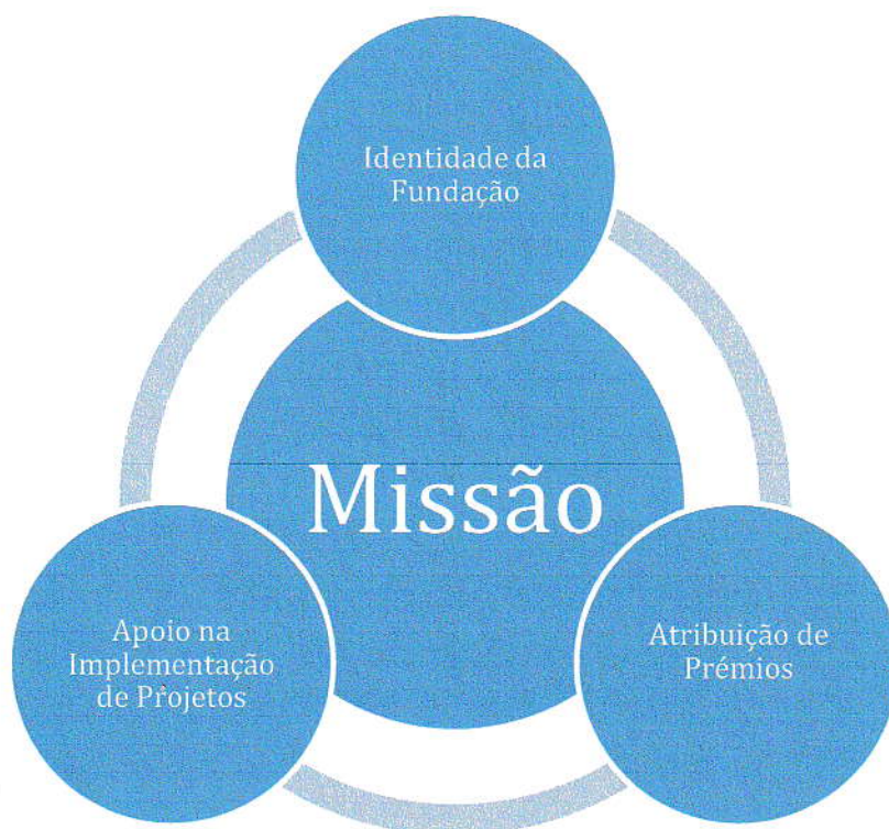
Figura 1 – Eixos de intervenção no âmbito da Missão