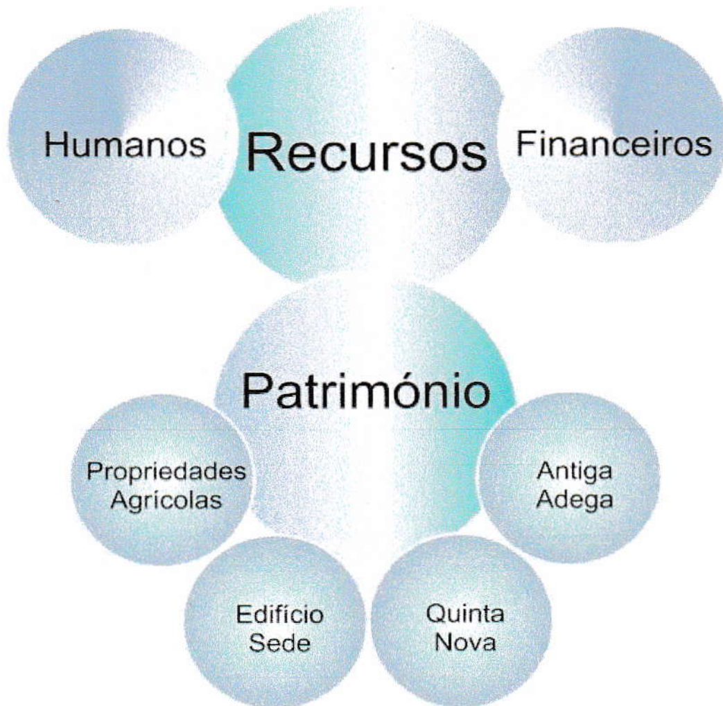
Figura 2 - Eixos de intervenção no âmbito dos Recursos