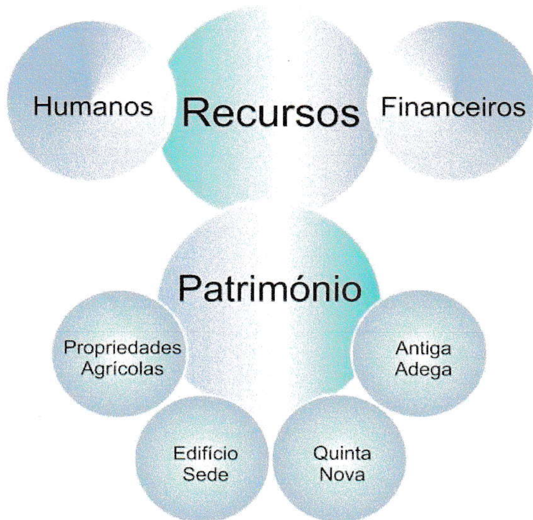
Figura 2 - Eixos de intervenção no âmbito dos Recursos