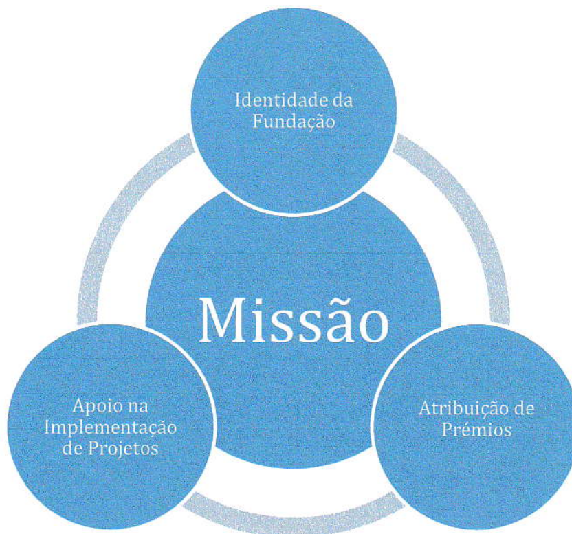
Figura 1 – Eixos de intervenção no âmbito da Missão