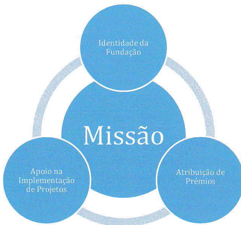
Figura 1 – Eixos de intervenção no âmbito da Missão