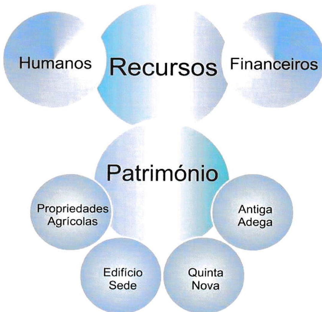
Figura 2 - Eixos de intervenção no âmbito dos Recursos