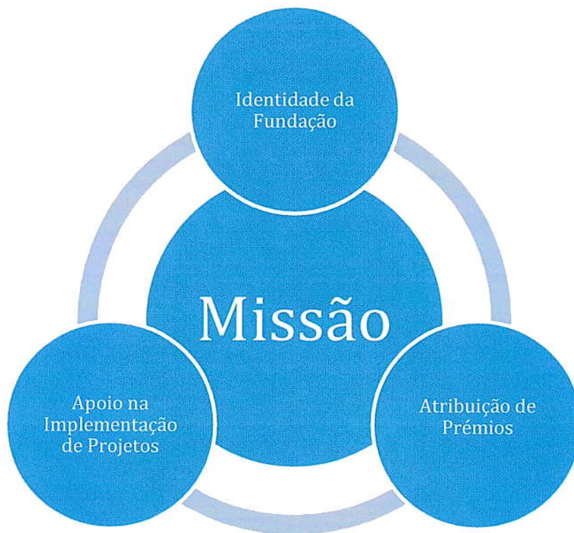
Figura 1 – Eixos de intervenção no âmbito da Missão